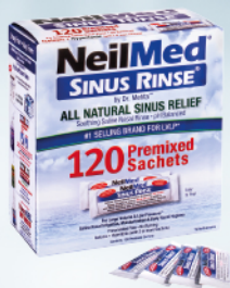
Sinus Rinse - zestaw uzupełniający do butelki 240ml