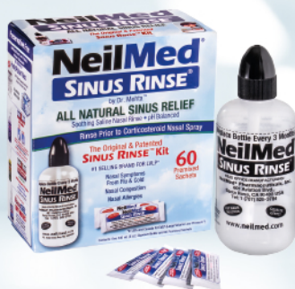
Sinus Rinse - zestaw podstawowy dla dorosłych