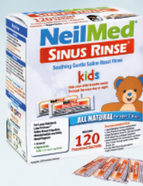
Sinus Rinse - zestaw uzupełniający dla dzieci (od 2lat)

Do dalszej kuracji zestawy uzupełniające bez butelki z większą ilością saszetek, bardziej ekonomiczne.