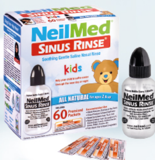
Sinus Rinse - zestaw podstawowy dla dzieci (od 2 lat)

Zestawy podstawowe z butelką i 60szt. saszetek pozwalają na przeprowadzenie miesięcznej kuracji.