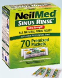
Sinus Rinse - zestaw uzupełniający do butelki 240ml